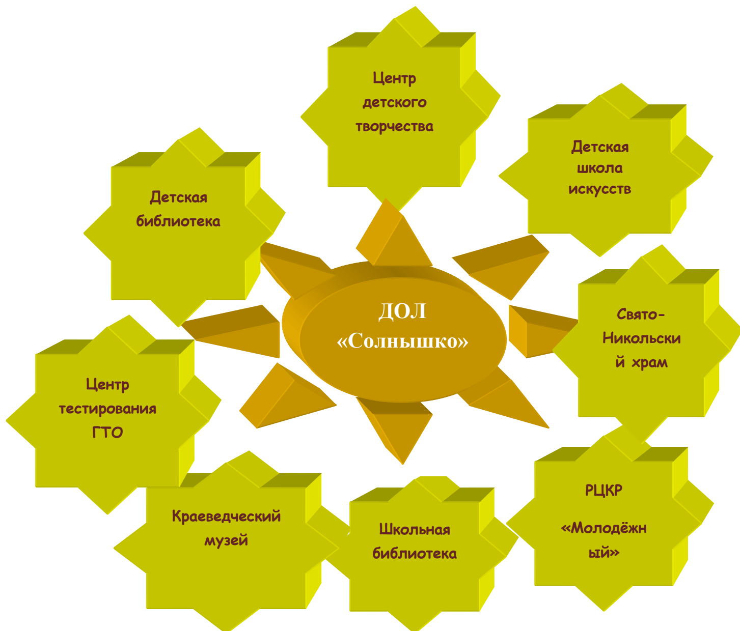
Схема взаимодействия пришкольного лагеря «Солнышко» с социумом в реализации программы